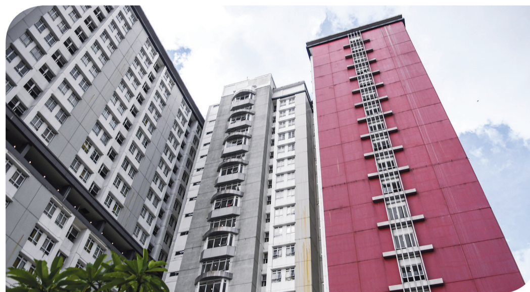
PEMERINTAH SIAPKAN TOWER 8 WISMA ATLET PADEMANGAN

Suasana dari Tower 8 Rumah Sakit Darurat COVID-19 (RSDC) Wisma Atlet Pademangan, Jakarta, Selasa (15/6). Satuan tugas penanganan COVID-19 bersama Pemerintah Provinsi DKI Jakarta akan membuka tower 8 RSDC Wisma Atlet Pademangan dengan menyediakan tempat perawatan bagi pasien terkonfirmasi positif COVID-19 sebanyak 1.569 tempat tidur.